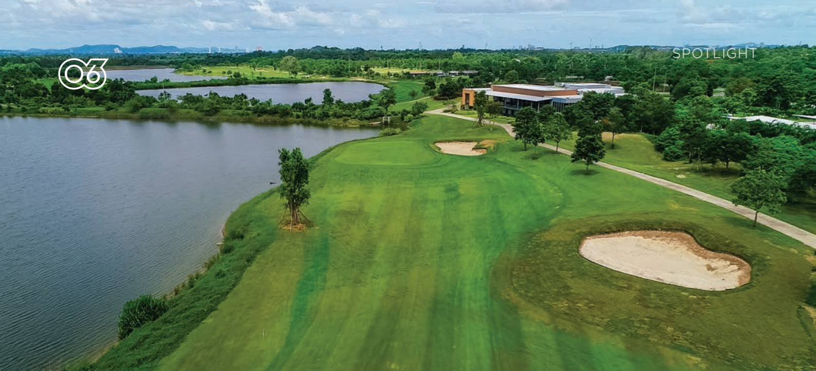
O1 Hole 18