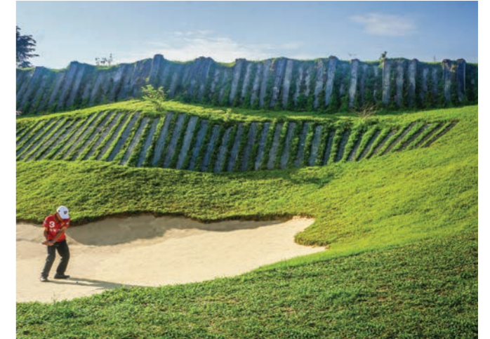
Hole 15 - "Wall of Death"

ส่วนการบริหารงานนั้น ได้ให้ความสำคัญคำนึงมององค์กร 3 คำ "ชื่อสำคัญ สามารถ ขยัน" ที่ทุกคนควรยึดและปฏิบัติตาม เพื่อช่วยกันนำองค์กรธุรกิจ