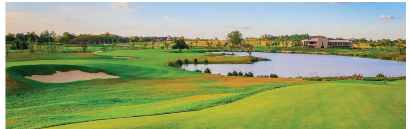
Siam Country Club Pattaya Rolling Hills

ที่สำคัญ บุคลากร คือ ทรัพย์สินอันมีค่าขององค์กร เราเน้นทำงานเป็นทีมและพร้อมก้าวไปข้างหน้าด้วยกัน ซึ่งผมได้สร้างมาตรฐานการบริการบุคลากรแบบ Skills Improvement เพื่อยกระดับมาตรฐานและสนับสนุนการพัฒนาคนแบบยั่งยืน และในอนาคต มั่นใจว่า "สยามกัณฑ์คลับ" คือเพชรเม็ดงามในภาคตะวันออก และหนึ่งเดียวในเอเชีย และเป็นสวรรค์ของนักกอล์ฟอย่างแท้จริง