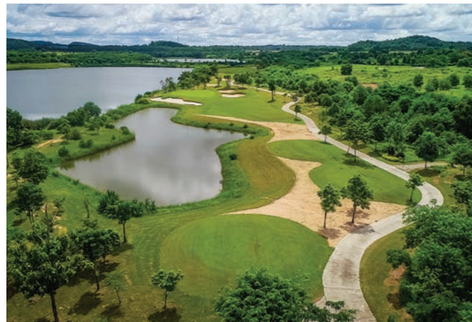
O2 Hole 16