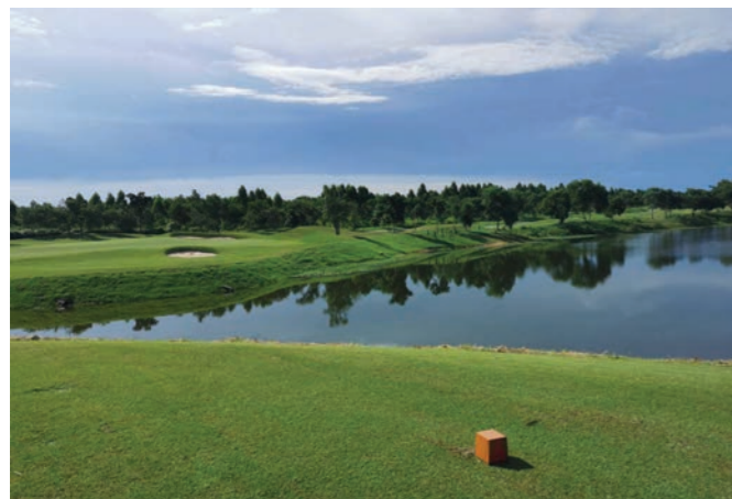
O3 Hole 7

สยามคันทริคคลับ พัทยา วอเตอร์ไซด์ เอาใจคนรักกีฬาตลอดทั้งปีกับการปรับโฉมใหม่ให้สวยงาม และเล่นสนุกมากขึ้นทั้ง 18 หลุม ที่ใช้เวลา 3 เดือน ในการปลูกต้นไม้และปรับแต่งใหม่เพิ่มเติม รวมทั้ง ย้ายต้นไม้จากที่เดิมไปอยู่ในพื้นที่ที่เหมาะสม ส่วนบังเกอร์ทั้งหมดได้รับการปรับแต่งใหม่ให้มีขนาดรูปร่างหลากหลาย และมีความเด่นมากขึ้น เหมาะสำหรับการเล่นแทนที่ใหม่ที่ถูกรื้อสร้างขึ้น เพื่อเสริมทัศนียภาพใหม่ เป็นตัวเลือกในการวางเกมส์กอล์ฟให้สนุกขึ้น แม้แต่หญ้าที่ยาว และเหนียวเป็นอุปสรรคต่อการเล่นก็ถูกแทนที่ด้วยหญ้าที่เป็นมิตรแก่นักกอล์ฟมากขึ้น ส่วนแฟร์เวย์ ได้รับการปรับเส้นสายของแฟร์เวย์ให้กว้างและสวยงามขึ้น มั่นใจว่าสร้างความพึงพอใจแก่นักกอล์ฟอย่างแน่นอน และนี่คือ รูปลักษณ์ใหม่ ที่ทำให้ได้สนามกอล์ฟที่มีความตื่นเต้นขึ้นอีกครั้ง และน่าเล่นมากกว่าเดิม All New Waterside